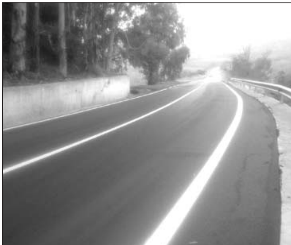
Il nuovo asfalto sulla Sp13 nel tratto della masseria D'Anela. In basso il semaforo sulla Statale 7 all'altezza del ponte di Santa Colomba

Nell'occasione si prevede la chiusura di una sola corsia; quindi, il traffico non sarà